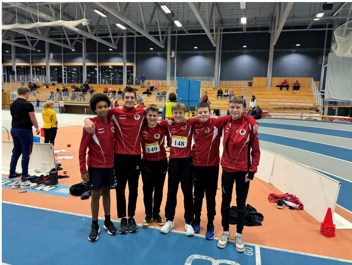
God stemning på Steinkjer Indoor