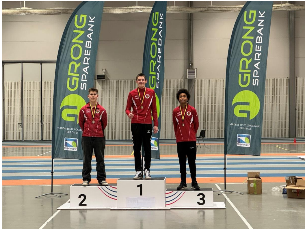
Rent bord til Herøy i Steinkjer